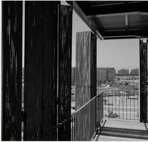
La Casa de Bambú en Madrid, una Vivienda de Protección Oficial muy especial.