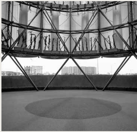
Interior de uno de los tres Árboles Bioclimáticos del Eco Bulevar en Madrid.

sus realizaciones urbanas a concurso y fueron elegidas para participar en el pabellón común de ciudades (aunque finalmente Santiago de Compostela y Zaragoza declinaron la invitación), lo que convierte a España uno de los países con mayor número de ciudades participantes.