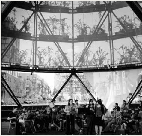
Los Árboles Bioclimáticos son un lugar de interacción social.

Las réplicas adaptadas de la Casa y del Árbol de Aire representan un modelo de ecología básica mediterránea (el “cuerpo” de la ciudad), un modelo de vida armónico y de convivencia (el espíritu de la ciudad), que evoluciona, se adapta, se transforma sin perder sus tradiciones y sabe gestionar sus proyectos (el “movimiento” de la ciudad).