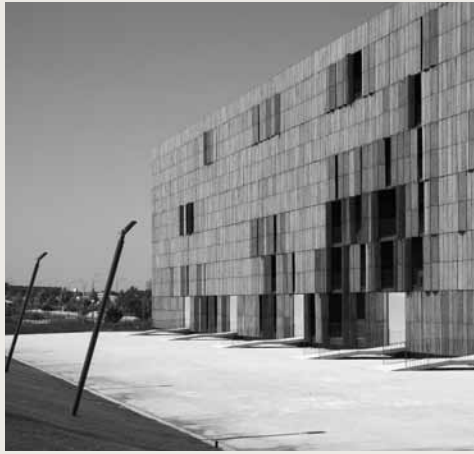
La Casa de Bambú en Madrid, en el barrio de Carabanchel.